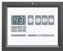
Externes öffentliches Steuerpaneel W.PS-01.P