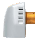
Düse für den Dampfgenerator or GWD.2