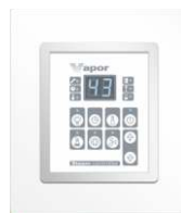
Externes Steuerpaneel mit dem Rahmen, Montage von PHEW3.RB.VAPOR möglich