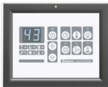
Externes Steuerpaneel W.PS-01