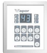
Externes Steuerpaneel PHEW3.VAPOR