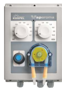
Aromatisierer VAPAROMA DA.01-01.PL