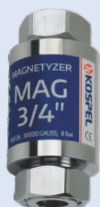
Magnétiseur MAG 3/4"