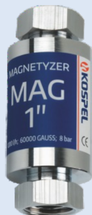
Magnétiseur MAG 1"

Détartrant magnétique empêche les dépôts de calcaire dans les installations d'eau. Ils fonctionnent sans entretien et sans frais d'exploitation.