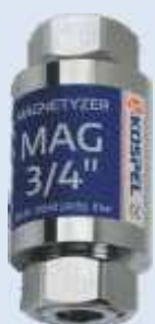
Magnetyzer MAG 3/4"