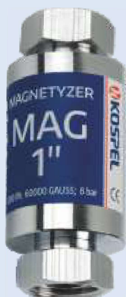
Magnetyzer MAG 1"

Zapobiegają osadzaniu się kamienia kotłowego w instalacjach wodnych. Pracują bezobsługowo i bez kosztów eksploatacji.